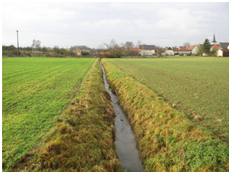
Gewässer ohne Gewässerrandstreifen