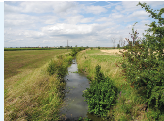
Gewässer mit Gewässerrandstreifen