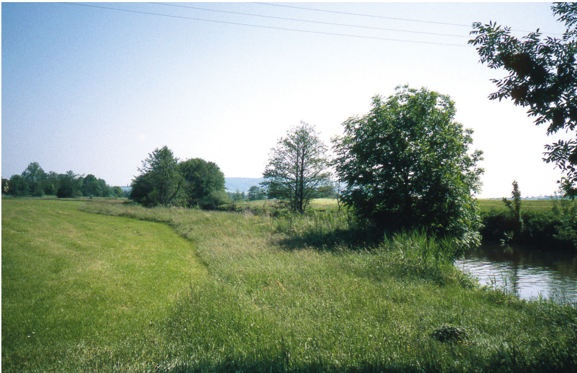
Gewässerrandstreifen mit Beschattung für das Gewässer

Durch die Ausgleichsregelung erhalten Landwirte in den ersten 5 Jahren 500 Euro pro Hektar und Jahr und in den darauffolgenden Jahren 200 Euro pro Hektar und Jahr. Die Abwicklung der Ausgleichszahlungen erfolgt über die Landwirtschaftsverwaltung. Ansprechpartner sind die Ämter für Ernährung, Landwirtschaft und Forsten. Anträge können immer ab Mitte März im Rahmen des Mehrfachantrags gestellt werden.